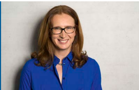
Gisela Stang

von Gisela Stang, von 2001 bis 2019 Bürgermeisterin der Stadt Hofheim am Taunus