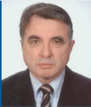
Werner Schweizer © privat