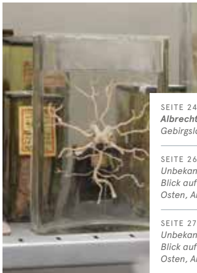
SEITE 24/25 Albrecht Altdorfer; Gebirgslandschaft bei