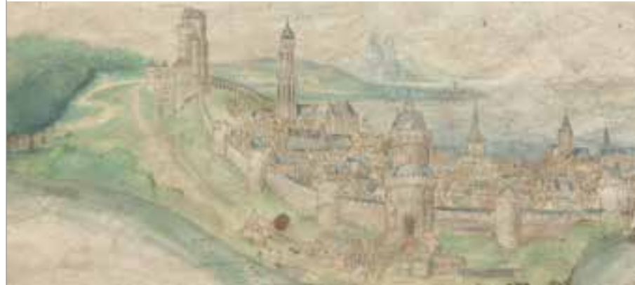
SEITE 11 Pleydenwurff, Hans (Werkstatt); Ansicht einer befestigten Stadt, nach links ansteigend, mit hohem Kirchturm links. Im Hintergrunde nach rechts sich öffnendes Meer; B 139, Graphische Sammlung der FAU

dass er sie zwischen 1516 und 1528 gezeichnet haben muss – darauf deuten realitätsgetreue Details an den Gebäuden hin. Somit gilt diese Zeichnung als ältestes naturgetreues Panorama Nürnbergs, das vor Ort entstanden ist.