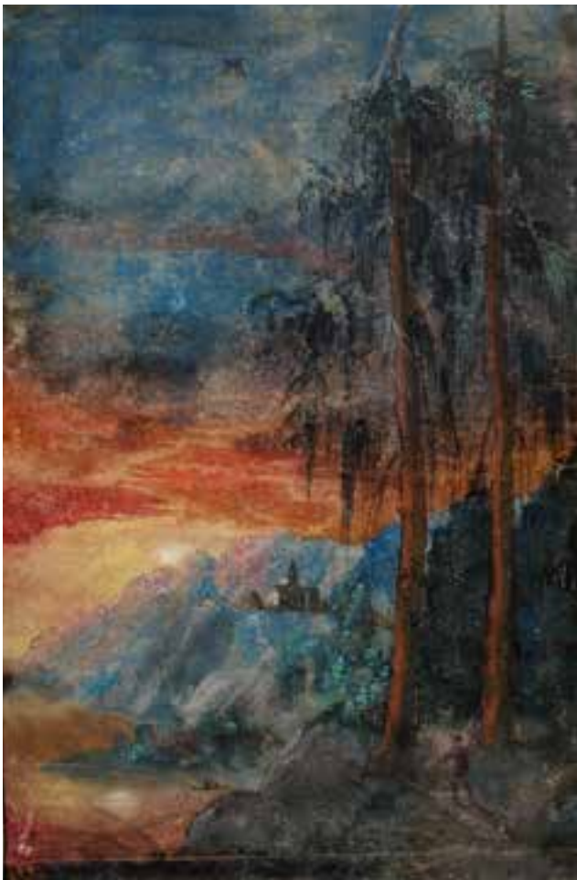
SEITE 10 Albrecht Altdorfer; Gebirgslandschaft bei Sonnenuntergang; B 812, Graphische Sammlung der FAU