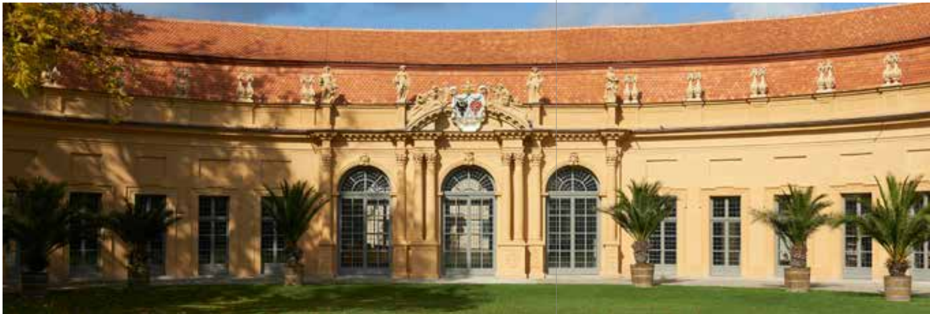
Unbekannter Künstler; Eine Reihe aufblickender Frauen und Engel, von unten gesehen, auf Wolken; B1213, Graphische Sammlung der FAU

DER UNIVERSITÄTSBUND ERLANGEN-NÜRNBERG E.V.